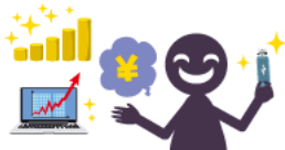
マルチ商法 (USB投資詐欺)