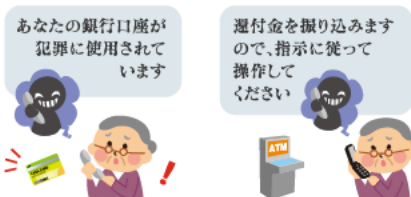
キャッシュカード詐欺盗