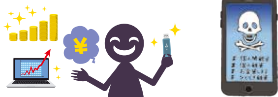
マルチ商法（USB投資詐欺）