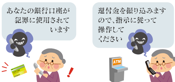
キャッシュカード詐欺盗