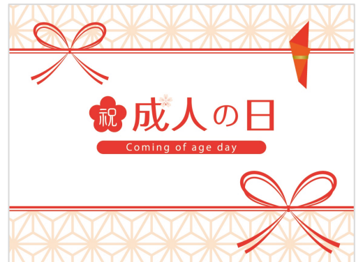
2022 年 4 月から成年年齢が 18 歳に引き下げられるが、成人式の対象を 20 歳のままとし、式の名称を「二十歳を祝う会」などに改称する自治体の動がある。

現代社会では、お金との関わりを避けて生活することはできない。協会では金融リテラシー向上に向けた取組みを、協会の目的の一つである「資金需要者等の利益の保護を図る」ための中心的な施策と位置づけ、関係省庁や他団体との連携を密にし、施策のさらなる拡充に取り組んでいく。